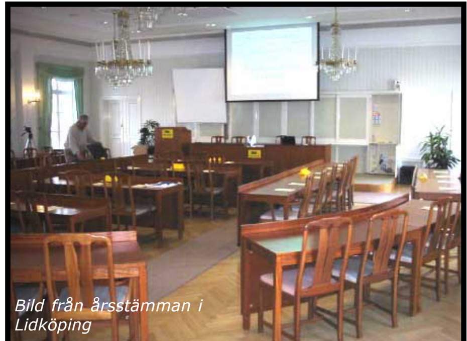
Bild från årsstämman i Lidköping